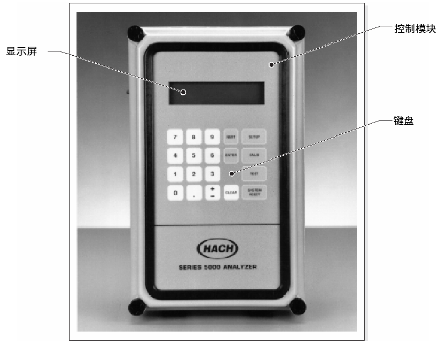
图 2 控制模块