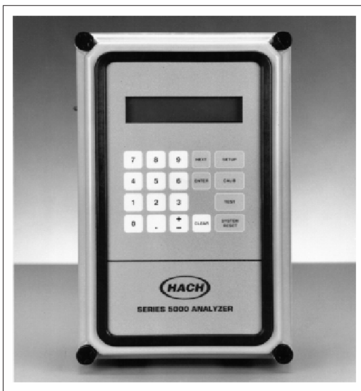
图 6 键盘